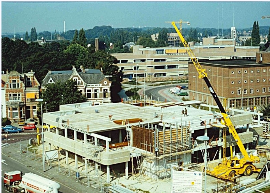
Boulevard 1945-1 Hoek Haaksbergerstraat Nijverheidstraat, nieuwbouw van de Nederlandse Middenstands Bank (NMB). september. 1980. Het pand staat op de nominatie voor herontwikkeling of sloop.

In 2019 kreeg dit pand een nieuwe bestemming als restaurant. Niet alle villa's aan de Nijverheidstraat hebben de tand des tijds doorstaan.