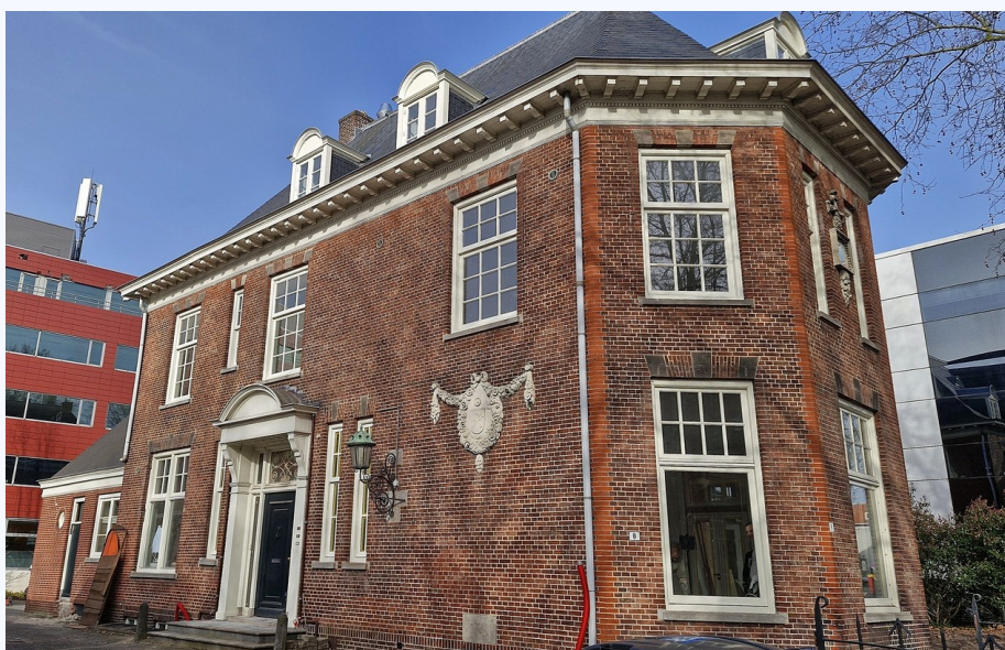
M.H. Tromplaan 8 in Enschede.

De vereniging Protestantse Zieken Verpleging begon in april 1891 in Enschede met de wijkverpleging. Het doel was om in de behoeftige aan verpleging in de zich ontwikkelende fabrieksstad te voorzien. De wijkverpleging was in Enschede zeer noodzakelijk ook gezien het aantal beperkte ziekenhuisbedden. Na ruim 130 jaar heeft zich deze zorg ontwikkeld tot de thuiszorg, een belangrijke schakel in ons huidige zorgsysteem.