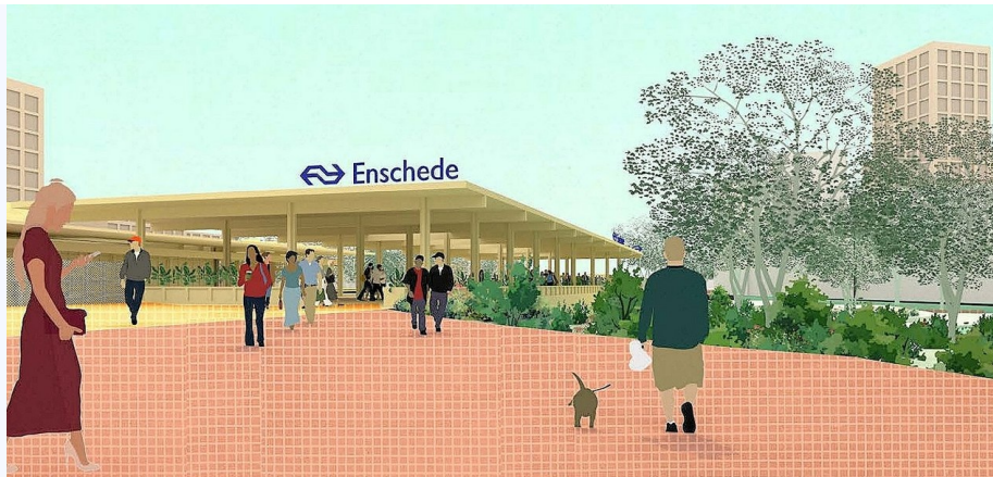
De nieuwe zuidwest ingang van het NS Station.