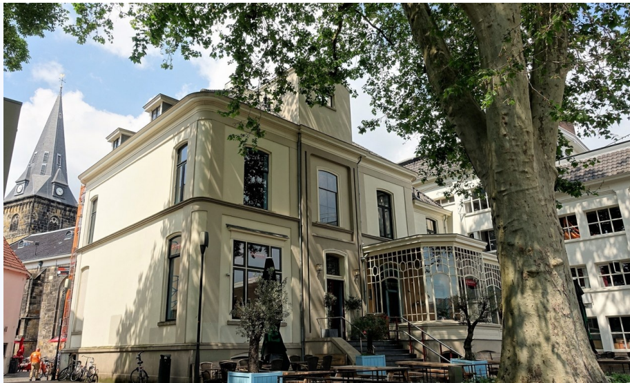
De Klokkenplas met het voormalige woonhuis "De Hoge Stoep" van de familie Van Heek

We keren terug naar de Klokkenplas een bijzonder pleintje in het centrum van Enschede met een historisch verleden. De Klokkenplas-plataan is een bijzondere boom in Enschede. De plataan aan de Klokkenplas is de oudste boom in het centrum van Enschede en heeft daarom een bijzondere monumentale status. De boom staat geregistreerd in het Landelijk Register Monumentale Bomen , wat betekent dat hij (naast zijn leeftijd) ook op basis van omvang, schoonheid of cultuurhistorie belangrijk is. De boom is ongeveer 150 jaar oud en maakte vroeger deel uit van de tuin van de familie Van Heek.