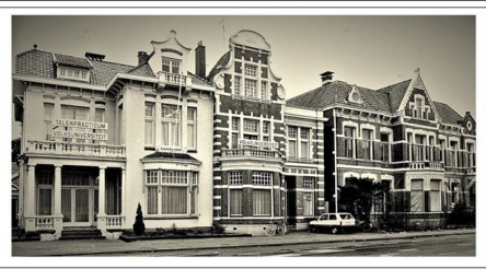
Deze kantoorkolos kwam in de plaats van de Villa's aan de Nijverheidstraat.