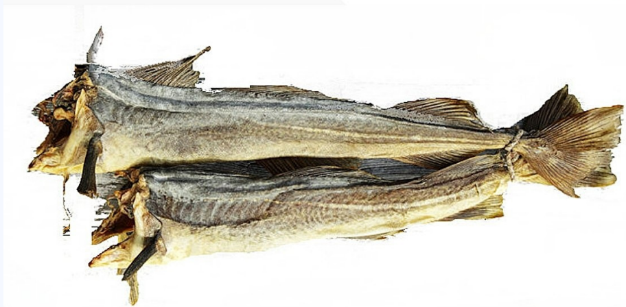
Ook in Nederland is bij vis speciaalzaken nog altijd stokvis te krijgen.

Het klinkt allemaal als culinair erfgoed want deze gedragsregels worden in Nederland nog maar heel beperkt toegepast met uitzondering van de Ramadan in de Islamitische gemeenschap. Maar het zal u verbazen want in het boerderij restaurant Biohof Mausacker aan de Bodensee in Zwitserland wordt nog altijd stokvis geserveerd als een vasten delicatessie.