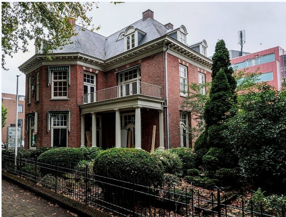
M.H. Tromplaan 8 in Enschede.