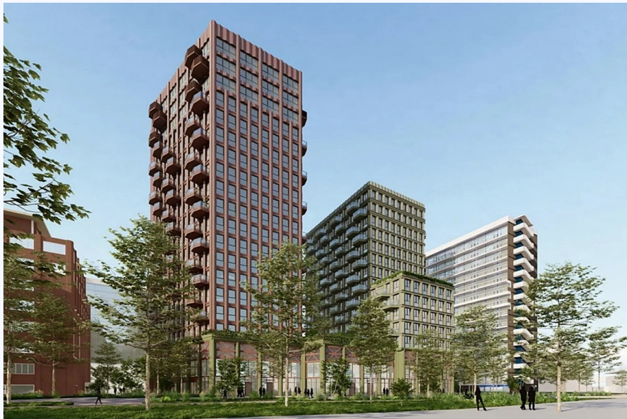
De nieuwe woontorens aan de kop van de Boulevard 1945.