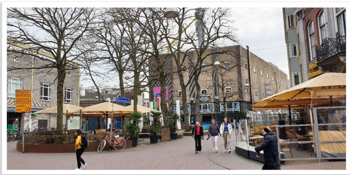
Het huidige Kruispunt De Graaff