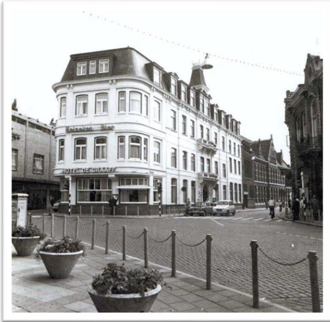
Hotel De Graaff omstreeks 1960