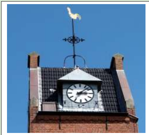
De hervormde kerk in Glanerbrug

Maar de kerktoren was en bleef een dominant architectonisch signaal in de stad, het dorp of de wijk.