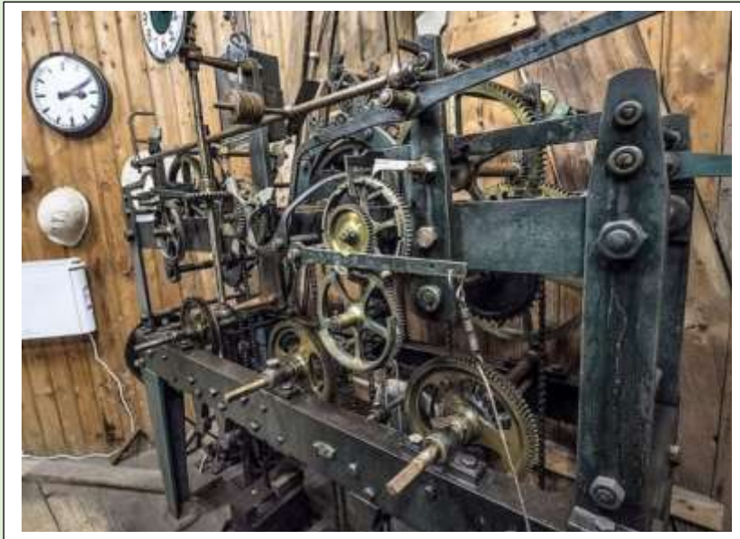
Het uurwerk van de kerktoren op de oude markt.