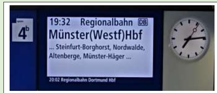
Enschede als grensstation bij de tijd.

Bij de aankomende en vertrekkende treinen zijn moderne digitale schermen, waarbij een klok is geïntegreerd, deze wordt gesynchroniseerd met de computerklok. Deze wordt op zijn beurt weer gesynchroniseerd door een atoomklok.