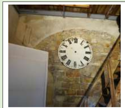
Een oude wijzerplaat van het uurwerk in de klokkentoren van de oude markt is nog aanwezig in de kerktoren.