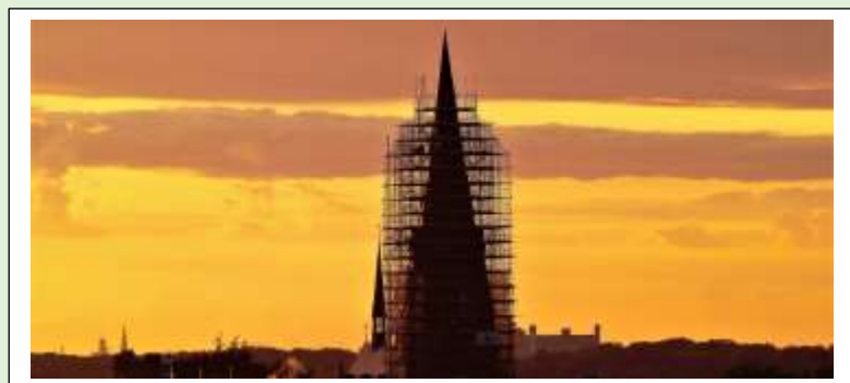
Restauratie van de kerktoren van de St. Josef Basiliek. 2016.

Het is bekend dat in sommige kerken in ons land vroeger een zandloper als tijdsaanduiding op de preekstoel stond om te zorgen dat de preek niet te lang of te kort duurde. Dat gebeurde overigens niet alleen hier. Een Engelse wet uit 1483 schreef voor dat uurwerken altijd boven de kansel moesten worden bevestigd, omdat de toehoorders anders het "preekglas" niet goed konden zien.