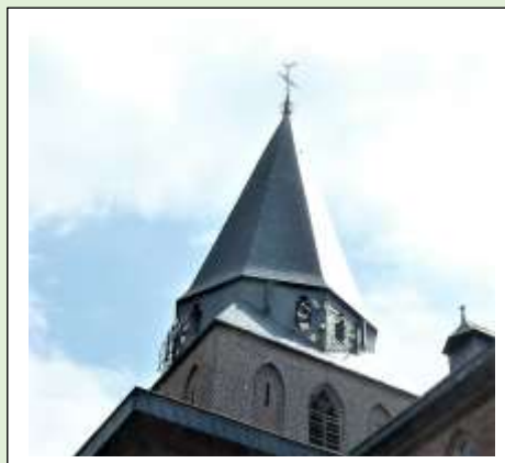
Jacobus de meerdere