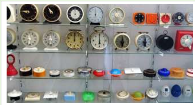
Een grote verzameling eierwekkers

In de Cornelis Houtmanstraat 39 in Glanerbrug bevindt zich het Zandloper Museum. Dit levenswerk van de heer Hennie Bijkerk eigenaar en conservator van het museum, resulteert in een verzameling van 1700 zandlopers, 400 kookwekkers, dokaklokken, stopwatches en bakerklokken. De zandlopers zijn er in verschillende uitvoeringen zoals: met bel, met één glas, uit een kerk of met inhalator. De kleinste zandloper is 25 millimeter, de grootste bijna 1 meter 80.