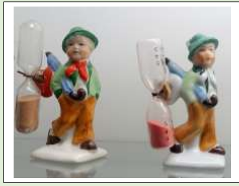
Zandlopers in alle formaten en uitvoeringen

De heer Bijkerk is ruim 30 jaar bezig geweest om zijn verzameling compleet te krijgen ofschoon zelf zegt hij dat er altijd weer nieuwe exemplaren opduiken. In 1988 is het verzamelen van zandlopers spontaan begonnen met de aankoop van een kleine zandloper op de Siepelmarkt in Ootmarsum.