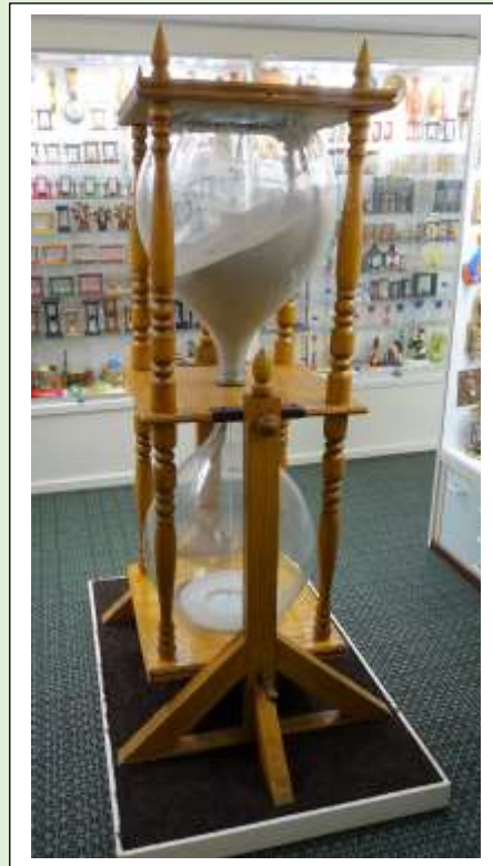
Zandloper met een hoogte van 1.80 meter

Het museum is uitsluitend te bezoeken op afspraak en de toegang is gratis.