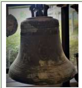
De 133 jaar oude luidklok