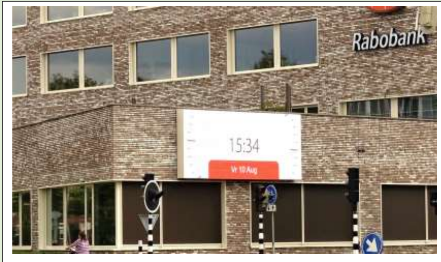
Digitaal beeldscherm op de buitengevel van de Rabobank aan de Zuiderval

D e moderne tijd vraagt volgens sommigen om veel meer informatie zoals tijdsaanduiding, buitentemperatuur het weerbericht en het laatste nieuws. We willen niets missen en de commercie speelt daar graag op in. Grote beeldschermen sieren c.q. ontsieren gevels van gebouwen waar reclame voor het bedrijf, de tijd, het weer, de buitentemperatuur en het laatste nieuws als een flits aan je voorbij trekken. Wat de toegevoegde waarde is van dit soort informatiedragers op drukke kruispunten is vooral een vraag voor marketeers. Er zal vast en zeker over nagedacht zijn.