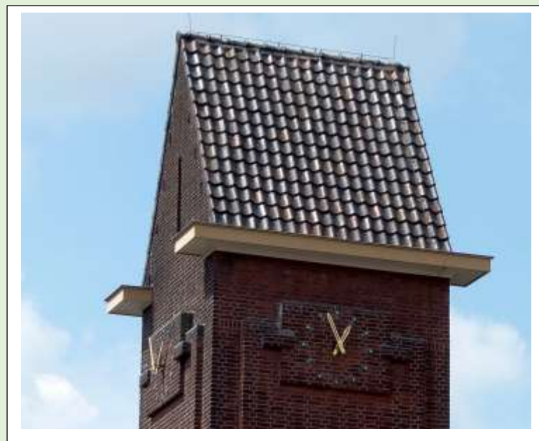
De openbare lagere school de Kosmos. [Stadsveld]

Hier is de klok subtiel aanwezig maar bij binnenkomst wist je wel hoe laat het was. "De Maere" dr. Ariens plein.