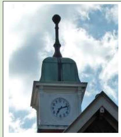
Voormalige West Indië school