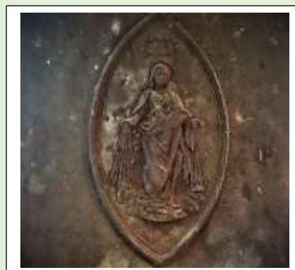
Afbeelding van Maria in de luidklok