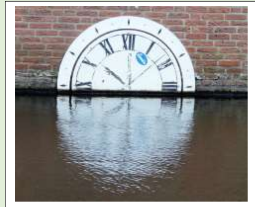
Kerktoren "het torentje van Drienerlo" Universiteit Twente.

H et Torentje van Drienerlo is een kunstwerk in een vijver op de campus van de Universiteit Twente in Enschede. Het werd in 1979 ontworpen door Wim T. Schippers.