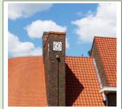
School Het Glanerveld

Hier is de klok subtiel aanwezig maar bij binnenkomst wist je wel hoe laat het was. "De Maere" dr. Ariens plein.