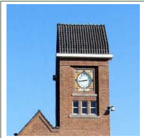
De Laarschool de Velve

De voormalige fabriek school aan de Richtersbleekweg is voorzien van een mooie klokkentoren met aan vier zijden de tijdsaanduiding. Het gebouw is een gemeentelijk monument en heeft nu een woonfunctie.