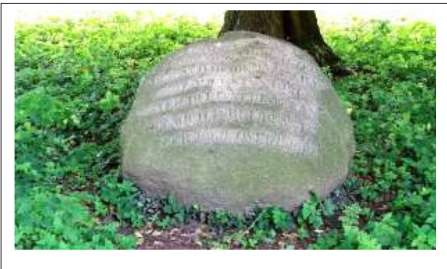
Gedenksteen Judith Hoeve