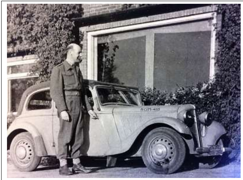
De Engelse inlichtingen officier Gig MacMillan bij villa Amelink in 1945

Deze inlichtingendienst is ingeschakeld om Duitse gevangenen te verhoren en vast te stellen wie betrokken was bij het plegen van oorlogsmisdaden. Het is een hechte vriendenclub, die ook na de oorlog decennialang jaarlijks een reünie organiseert.