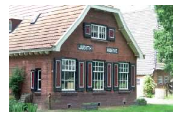
Boerderij Judith Hoeve