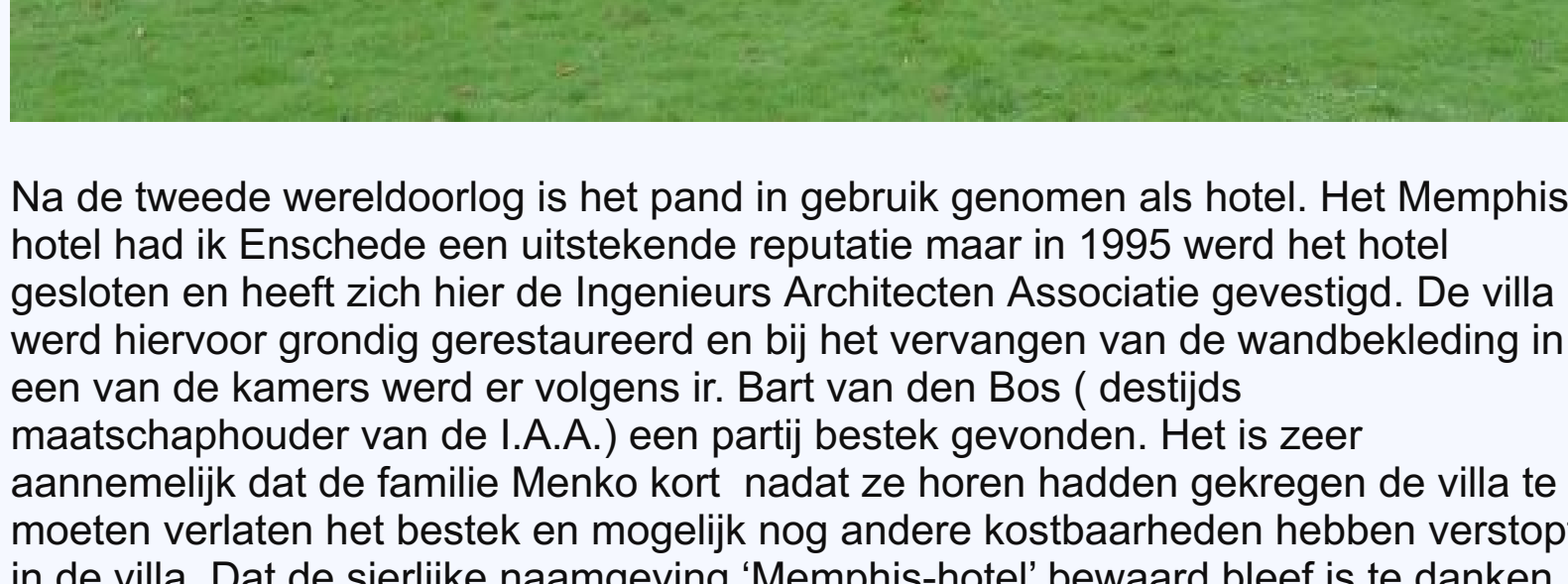
Foto onder de huidige tuin met kantoorvilla 2019