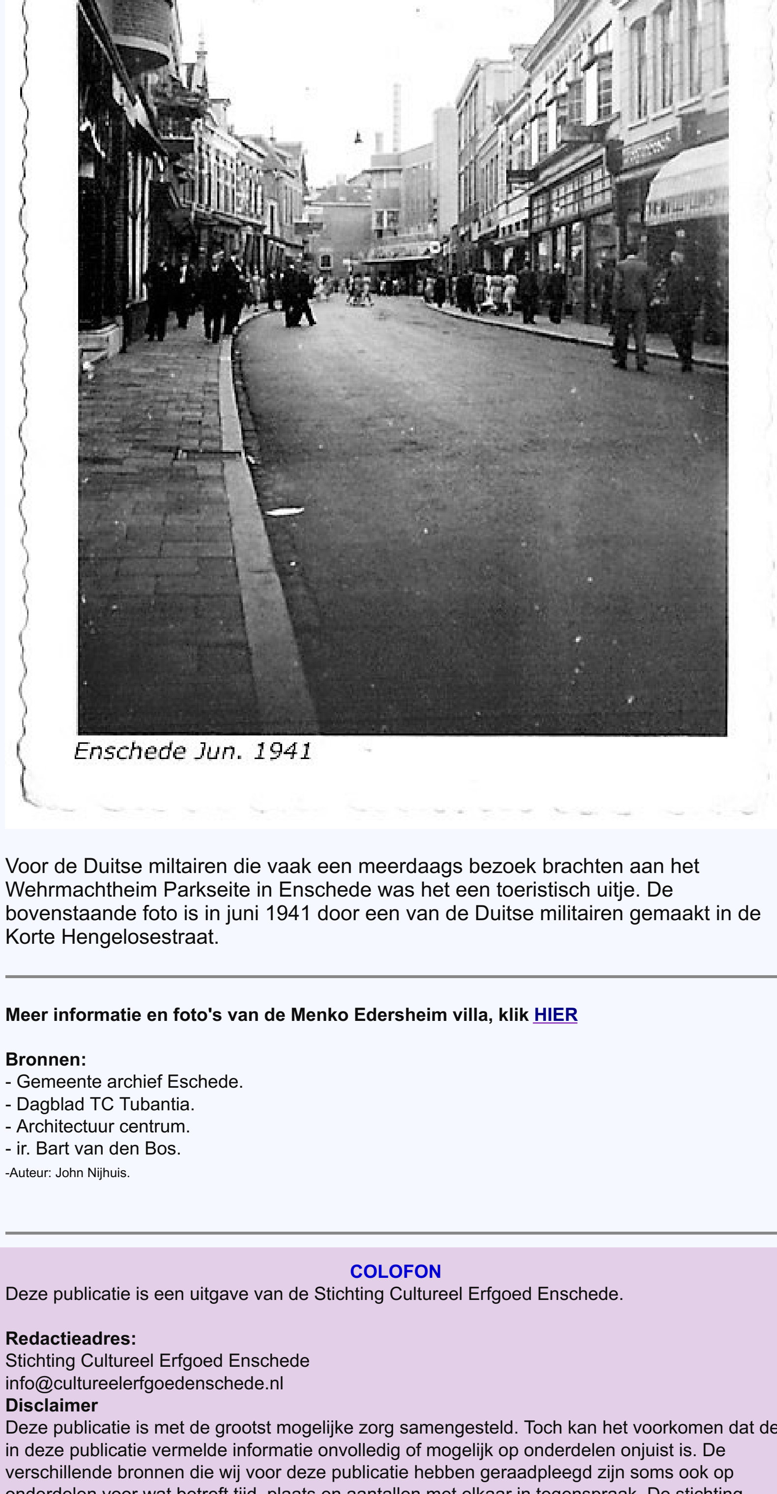
Enschede Jun. 1941