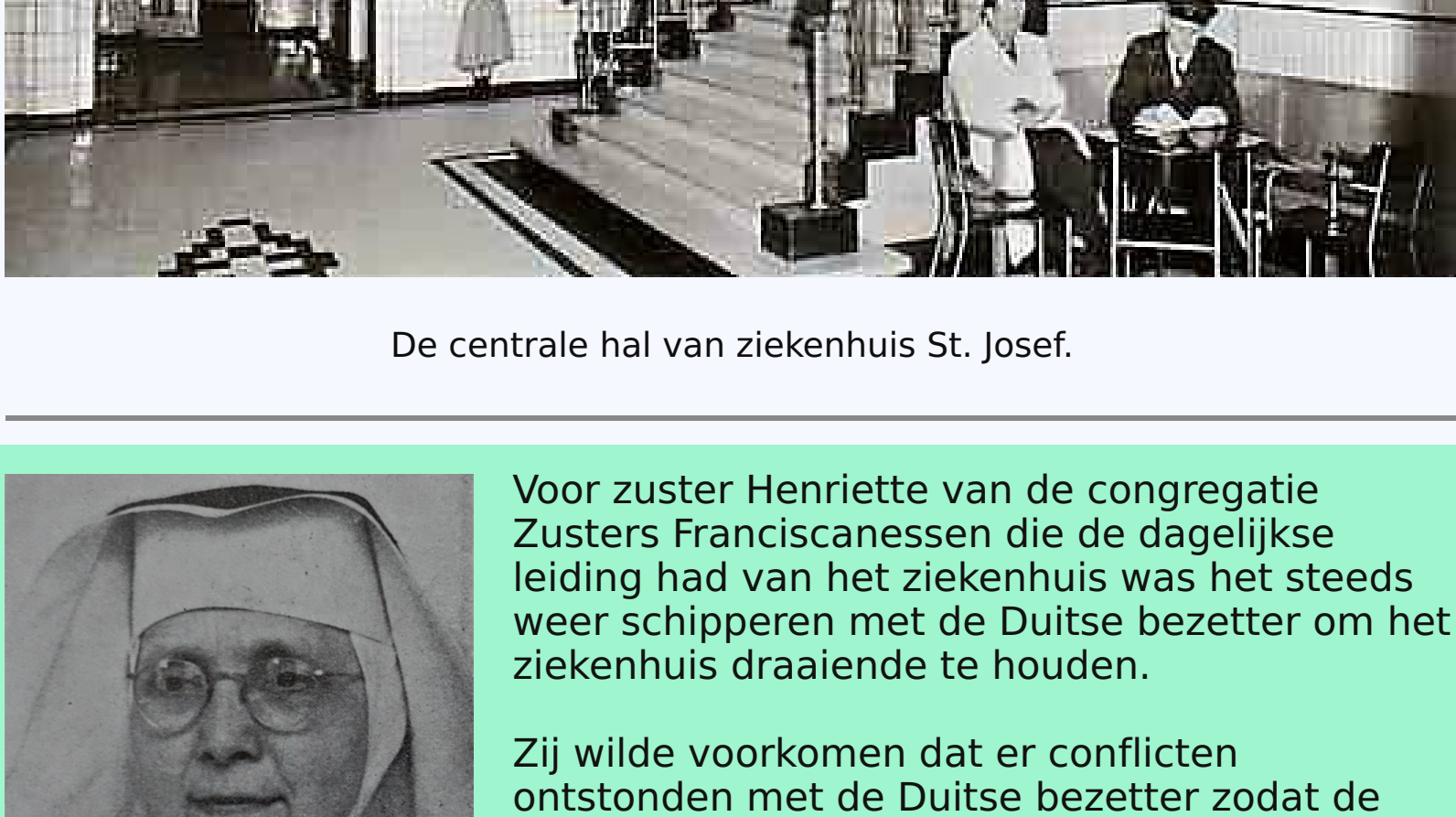
De centrale hal van ziekenhuis St. Josef.

Op 4 september 1944 kreeg generaal Kurt Student te horen van generaal Alfred Jodl, chef van Operaties van het OKW, dat hij was benoemd tot bevelhebber van het 1e Parachutistenleger. De parachutisten waren echter over heel Duitsland verspreid en behalve het 6e Regiment onder leiding van luitenant-kolonel van der Heydte bestonden de andere eenheden slechts uit rekruten, die nog in opleiding waren. Zijn strijdmacht bestond uit een bataljon van het 2e Parachutistenregiment, vijf nieuwe regimenten in opleiding en het 'Ausbildung Bataljon Hermann Göring', dat over antitankgeschut beschikte. Ze beschikten nauwelijks over zware wapens en eigen transportmiddelen. Na de mislukking van Market Garden nam de strijd in de sector van het 1e Parachutistenleger af. Vanaf november 1944 begon het Duitse opperbevel troepen te verzamelen voor een aanval in de Ardennen en de legers aan het westfront werden herschikt.