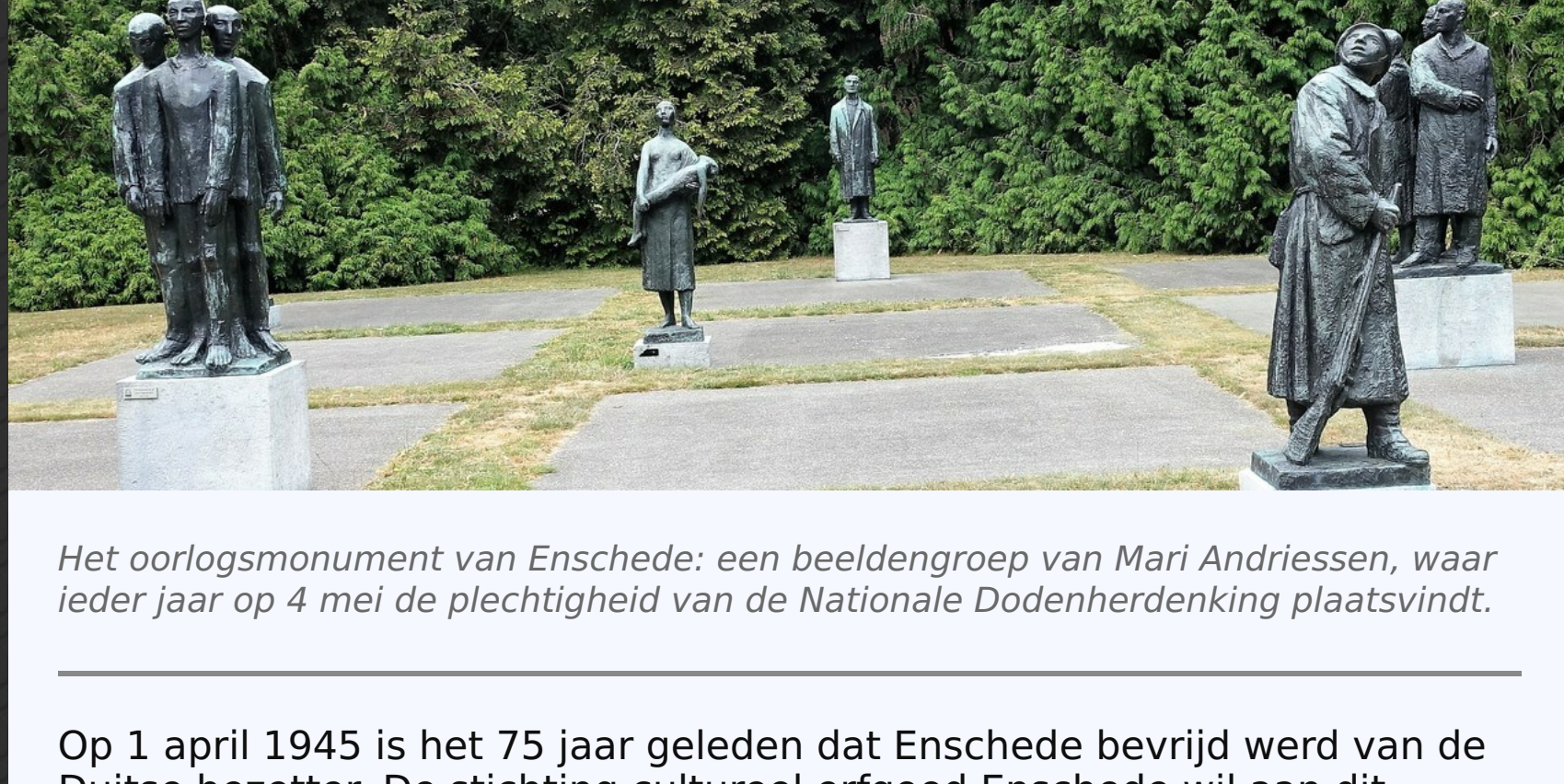
Het oorlogsmonument van Enschede: een beeldengroep van Mari Andriessen, waar ieder jaar op 4 mei de plechtigheid van de Nationale Dodenherdenking plaatsvindt.

Op 1 april 1945 is het 75 jaar geleden dat Enschede bevrijd werd van de Duitse bezetter. De stichting cultureel erfgoed Enschede wil aan dit herdenkingsjaar bijzondere aandacht schenken. In een aantal publicaties willen wij u informeren over wat zich in de oorlogsjaren heeft afgespeeld in Rijks en gemeentelijke monumenten in Enschede. Het zijn bijzondere verhalen geworden die soms ons voorstellingsvermogen te boven gaat maar zeer de moeite waard zijn om er kennis van te nemen. Wij willen monumenteigenaars en personen die aan deze publicaties hebben meegewerkt hierbij bedanken voor hun medewerking aan deze serie. In deze aflevering kijken we welke betekenis het ziekenhuis St. Josef in Enschede heeft gehad tijdens de oorlogsjaren.