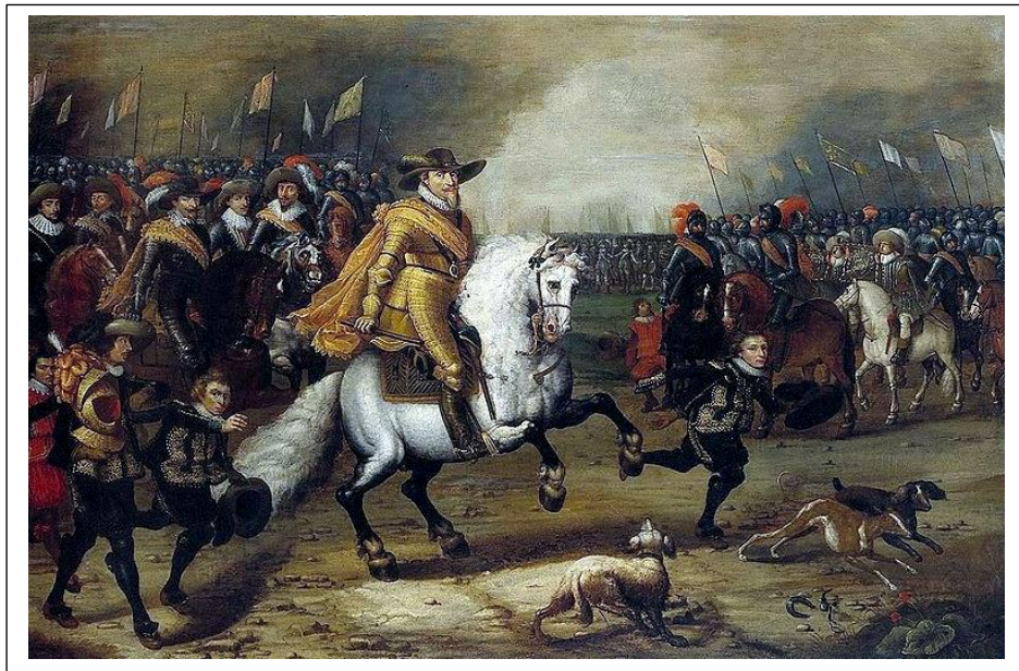
Prins Maurits bij aankomst op de Usseler es.

Veel delen van de es hebben een rijk archeologisch bodemarchief. Bewoningssporen komen voor vanaf het Paleolithicum, de Bronstijd, IJzertijd-Romeinse Tijd en Middeleeuwen. Bij bescheiden opgravingen is aardewerk, bewerkt vuursteen en houtskool gevonden en daarnaast zijn ook huttenleem, bot, baksteen, (metaal)slakken, kooltjes, sintels en zwarte schilfers aangetroffen. De zwarte schilfers zijn mogelijk te beschouwen als een soort verbrandingsresidu.