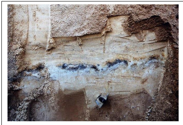
De laag van Usselo.

Maar waar maken we ons druk over? Hoe bijzonder is die es? Heel bijzonder in cultuurhistorisch opzicht!