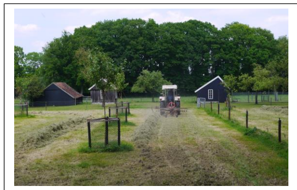
Kleinschalige landbouw aan de voet van de Usseler es. (2019)

In totaliteit was deze es samen met de omringende boerderijen en huiskampen met een oppervlakte van 155ha ooit de grootste van Europa. Het kransdorp rond de es is te beschouwen als het prototype van de oorspronkelijke bewoningsvorm. In deze krans, een zone met huiskampen en boerderijen, moet waarschijnlijk het oudste permanente akkerland gezocht worden. De es zelf is waarschijnlijk pas later in gebruik genomen. De bezitsspreiding van het akkerland op de es is gering. Het ligt meestal geconcentreerd in de buurt van de boerderij. Dit wijst erop dat de hoeven ter plaatse al aanwezig waren toen de es werd opgedeeld.