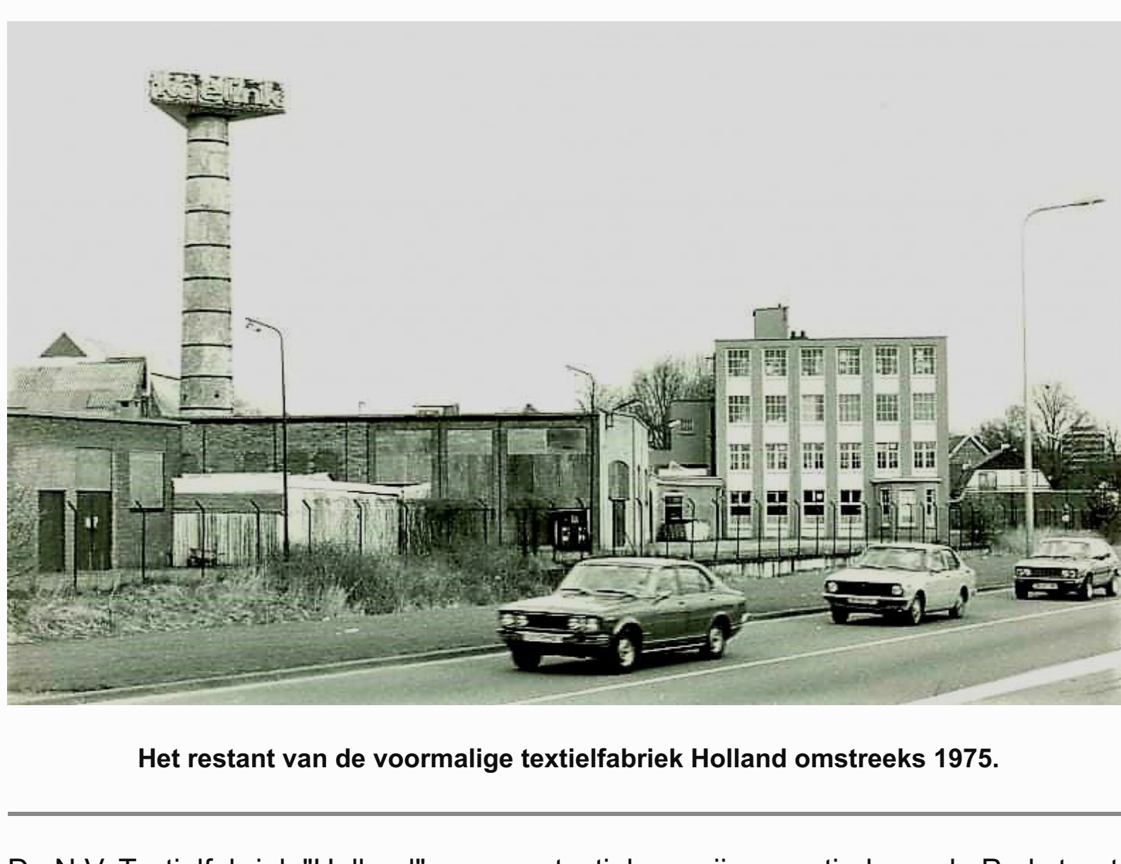
De textielfabriek van Holland was gelegen tussen de Parkweg, Borstelweg en Poolmansweg

In deze aflevering bij wijze van uitzondering geen oorlog geschiedenis over een monument maar wel een bijzonder verhaal over de textielfabriek Holland en de rol die ze vervulde tijdens de Tweede Wereldoorlog.