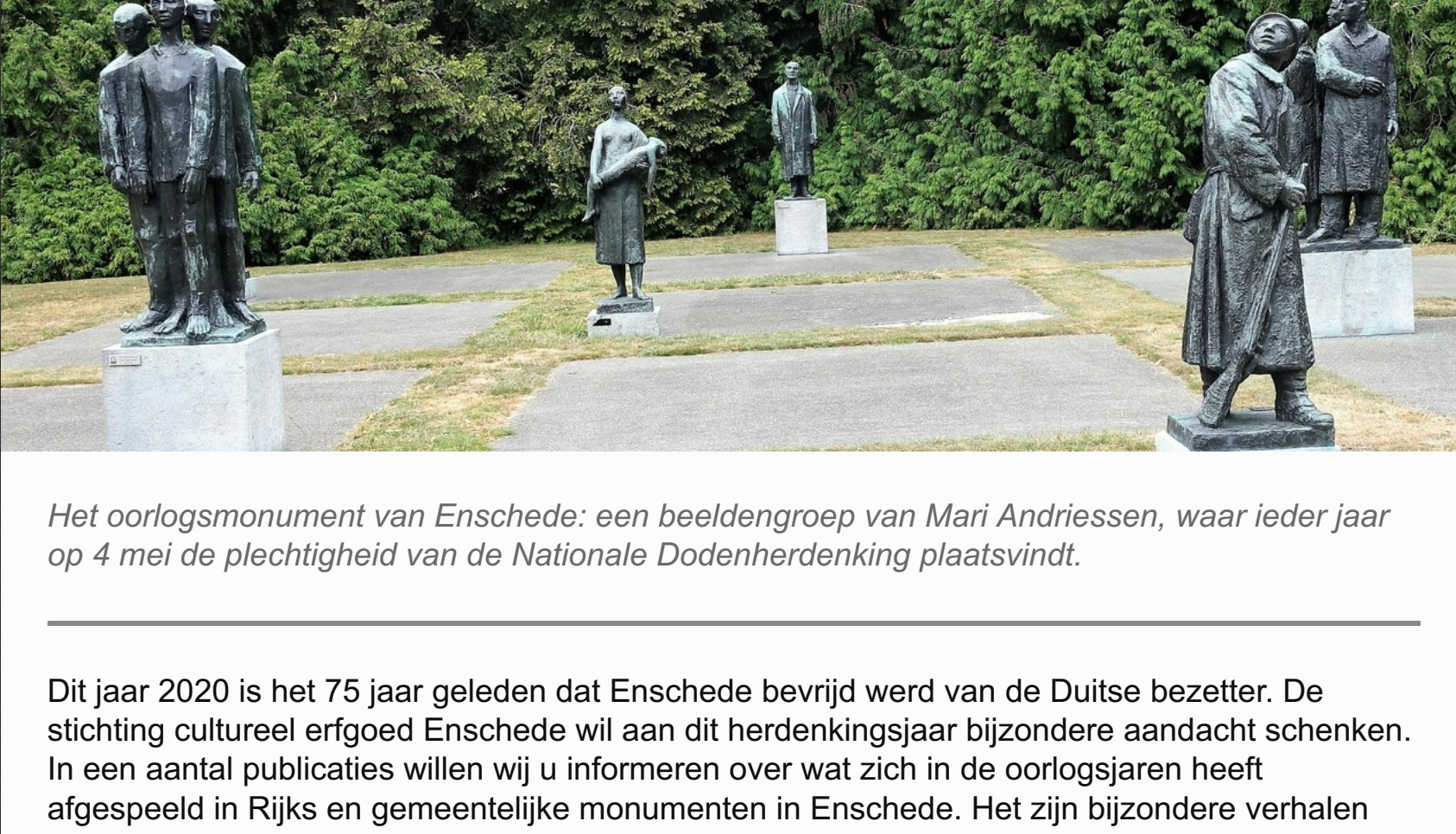
Het oorlogsmonument van Enschede: een beeldengroep van Mari Andriessen, waar ieder jaar op 4 mei de plichtigheid van de Nationale Dodenherdenking plaatsvindt.

Dit jaar 2020 is het 75 jaar geleden dat Enschede bevrijd werd van de Duitse bezetter. De stichting cultureel erfgoed Enschede wil aan dit herdenkingsjaar bijzondere aandacht schenken. In een aantal publicaties willen wij u informeren over wat zich in de oorlogsjaren heeft afgespeeld in Rijks en gemeentelijke monumenten in Enschede. Het zijn bijzondere verhalen geworden die soms ons voorstellingsvermogen te boven gaan maar zeer de moeite waard zijn om er kennis van te nemen, Wij willen monumenteigenaars en personen die aan deze publicaties hebben meegewerkt hierbij bedanken voor hun medewerking aan deze serie publicaties .