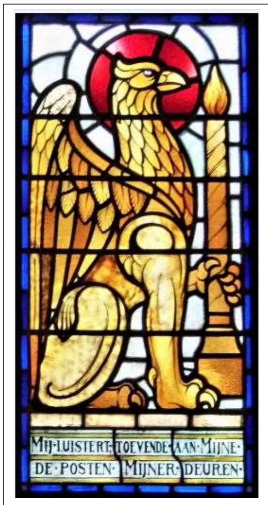
De griffioen: De tempelwachters in de ramen bij de ingang van de Synagoge.

Toch is dit gebouw getuige geweest van veel ellende, misdaden, maar ook staaltjes van grote moed. Als Nederland op 10 mei 1940 het slachtoffer wordt van de Duitse agressie telt Enschede 1264 Joodse inwoners. Vermoedelijk ligt dit aantal nog wat hoger dan hetgeen de burgerlijke stand, op basis van de vermelding van de godsdienst van de inwoners, aangeeft. In de jaren voorafgaand aan de oorlog zijn veel Joden Duitsland ontvlucht en een aantal heeft ook in Enschede en omgeving onderdak gevonden.*[1]