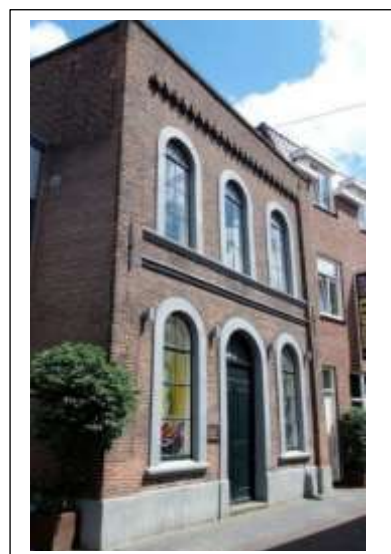
Foto rechts; Naast de Synagoge ontstond de Joodse school, nu nog terug te vinden in de Stadsgravenstraat. Dit gebouw heeft de status van gemeentelijk monument.

Het gebouw stond aan de Achterstraat, die later is omgedoopt in Stadsgravenstraat. De Thorarollen wisten de gebroeders Stofkoper bij de brand tijdig in veiligheid te brengen en al drie maanden later werd in een houten loods de noodsoel in gebruik genomen. In 1865 kon de Joodse gemeenschap, die grotendeels bestond uit kleine handelaren en winkeliers, de benodigde 16.000 gulden bijeen brengen voor de bouw van een nieuwe synagoge aan de Stadsgravenstraat.