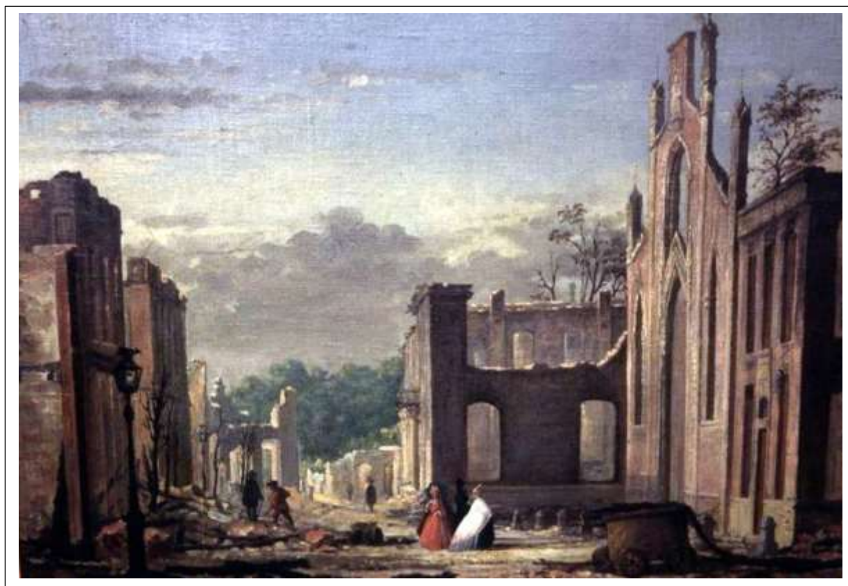
Langestraat Enschede Schilderij H. Valkenburg 1862.