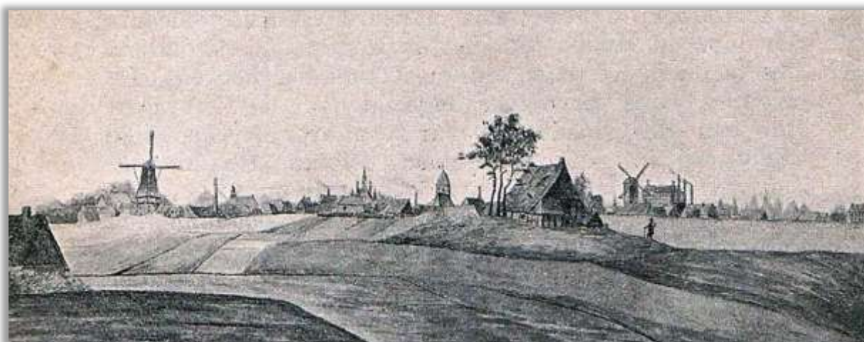
Panorama van voor de brand gemaakt vanaf de Gronauschenweg. Een illustratie uit het boekje uitgegeven bij de 50 jarige herdenking van de stadsbrand op 7 mei 1862.

"Wat gepakt was verbrandde op de wagens en de bruggen in de stad waren ook door de vlammen onbruikbaar geworden... Nog nooit hebben wij eene dusdanige verwoesting aanschouwd", zo beschreef een tijdgenote de onheilsplek.