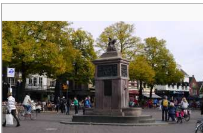
Herdenkingsmonument stadsbrand 7 mei 1862 oude Markt.