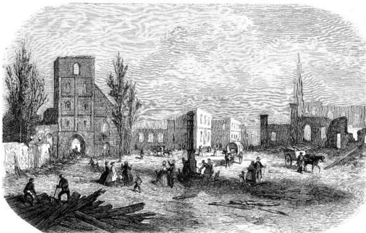
A.Deroy, graveur, tekening J.J. Broos - L'Illustration, Journal Universel, mai 1862