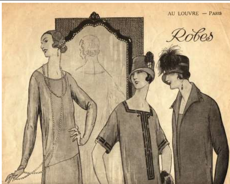
De Franse mode was toch een belangrijk bestanddeel van het assortiment van het warenhuis.