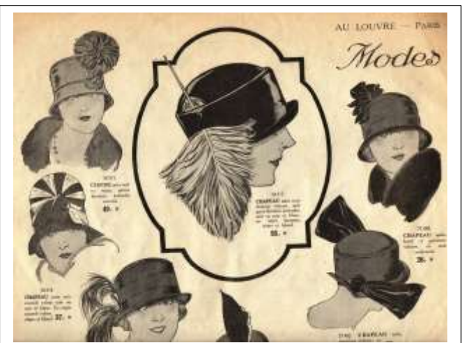
Belangrijke clientèle werden natuurlijk vanaf het treinstation Garde du Nord opgehaald en na het winkelen keurig bij het hotel afgezet met de nodige bagage en winkel inkopen. De service van dit warenhuis was voor die tijd al werkelijk ongekend.