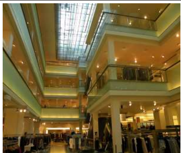
De Bijenkorf in Amsterdam [een Rijksmonument]. Volgens ons is hier toch sprake van enige bescheiden overeenkomst met Grand Magasins du Louvre in Parijs.