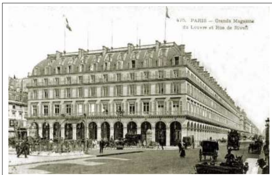
Het Galeries du Louvre is onderdeel van de Rue de Rivoli.

Kennelijk was er ook vanuit Enschede belangstelling voor de laatste woon en modetrends uit Parijs.