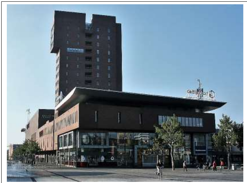
De Bijenkorf H.J. van Heekplein, Inmiddels Primark [2017]

Wat hebben de bovengenoemde warenhuizen met elkaar gemeen? Enschede prees zich in 2002 gelukkig met de komst van de Bijenkorf aan het H.J. van Heekplein. Het van H.J. Heekplein werd opnieuw ingericht en de Bijenkorf met 7800 m 2 winkeloppervlak was een luxe nieuwkomer waar Enschede trots op was maar achteraf gezien wellicht toch nog een beetje te luxe voor Enschede.