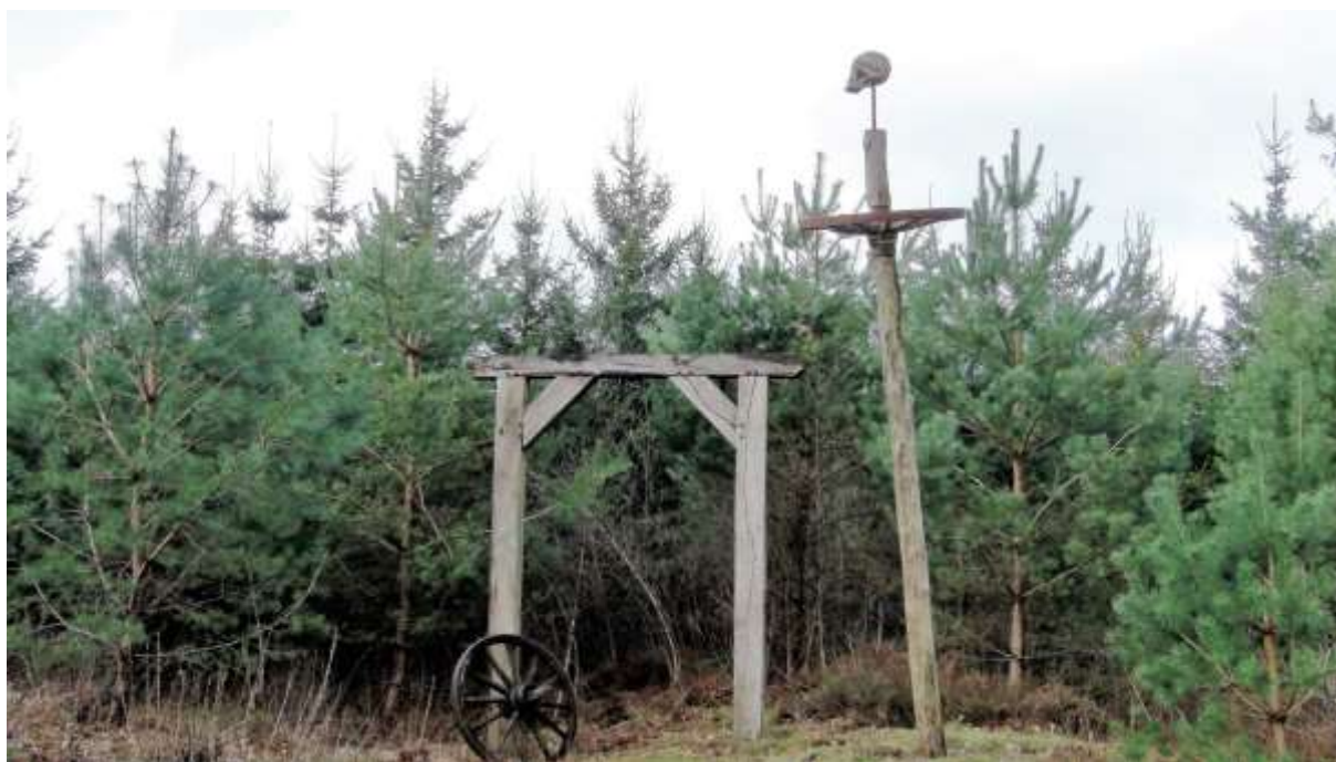
De huidige reconstructie van de Galgenbult.

De juiste ligging van de galg is op de oude kaart nog te zien. Hierop zijn ook op Nederlands grondgebied twee heuvels ingetekend, de zogenaamde Vossenbulten. Dit zijn nog overblijfselen van voor onze jaartelling. Het zijn restanten van grafheuvels die in het Twentse grensgebied veel te vinden zijn. Aan de andere kant van de Galgenbult bevond zich ook een uitgebreid grafheuvelveld uit de tijd voor Christus. Helaas is dit echter door de zandafgravingen aan het eind van de 19 e eeuw in dit gebied verwoest. Aangezien onze voorouders hun doden aan de Markegrenzen lieten begraven levert dit een aanwijzing dat de grens tussen Nederland en Duitsland niet willekeurig is getrokken maar reeds voor Christus verschillende stamgebieden werden afgesloten.