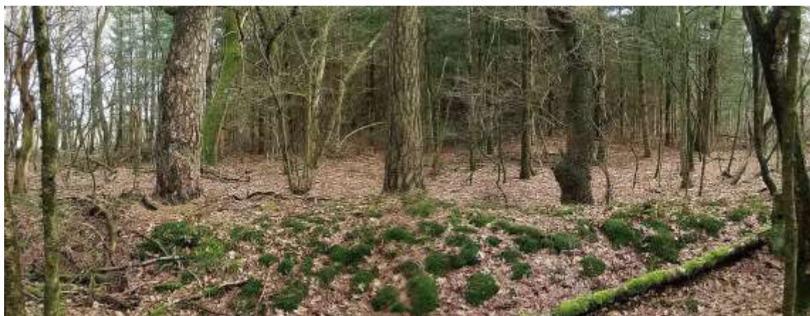
Restanten van de Landweren zoals deze nu nog voorkomen aan de Hessenweg.