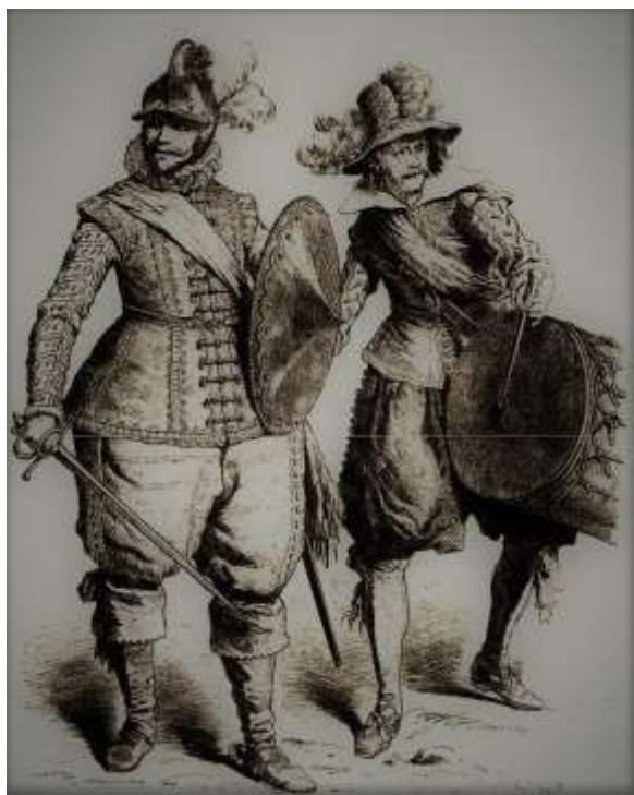
Duitse soldaten in de 17 e eeuw.