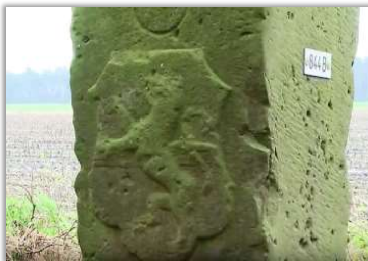
Oude grenssteen met wapen van Overijssel