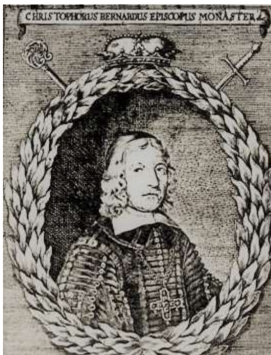
Bernard Von Galen [BommenBerend]

In die tijd werd ook de boerderij Helmert door de Vorst Bisschop gesticht. Ze werd bewoond door een luitenant die tevens aan het hoofd van het Kerspel Alstätte stond.