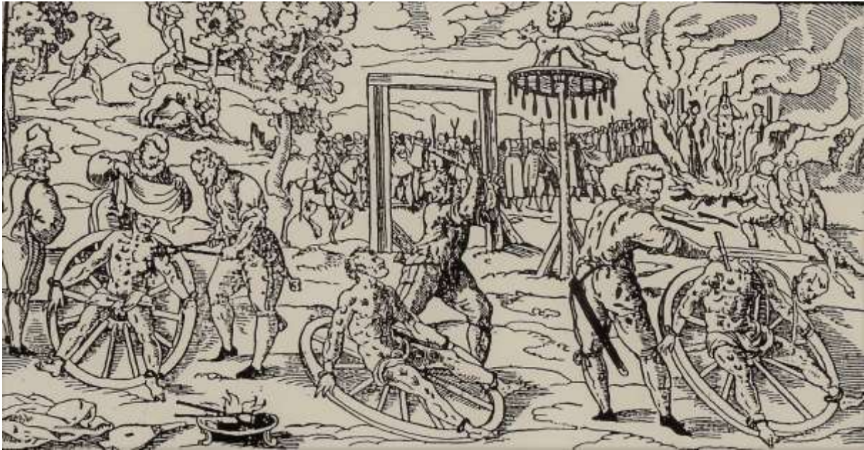
Kopergravure. De Galgenbult was in de middeleeuwen een ware slachtplaats ter afschrikking.

De huidige reconstructie van de Galgenbult laat twee verticale blaken en een horizontale dwarsbalk zien. Op de oude bovenstaande afbeelding ziet men naast de galg ook nog een paal met een wagenwiel zien. Op dit rad werd de misdadiger gelegd nadat alvorens alle ledematen werden gebroken het zogenaamde radbraken.