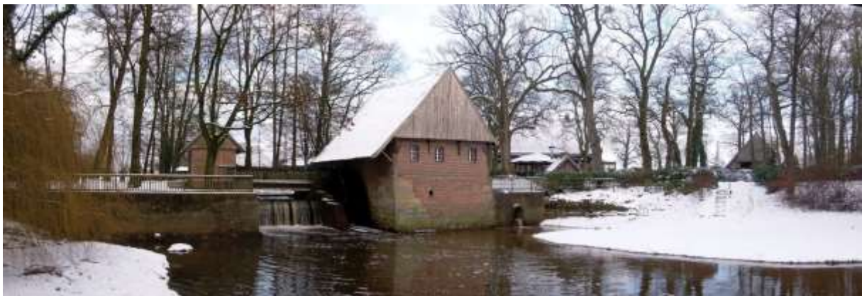
De watermolen gelegen direct naast de Haarmühle.

De huidige Nederlands-Duitse grens, die in 1769 definitief is vastgesteld en is gemarkeerd door grenspalen, is in feite het sluitstuk van een lange geschiedenis. Ze begint al in de 8e eeuw als in het voetspoor van de Franken en hun koning Karel de Grote zendingen onze regio binnentrekken om de bevolking te kerstenen. Willibrordus, Lebuinus en Ludger zijn namen, die tot in de huidige tijd voortleven als stichter cq. bisschop van kerken aan deze en gene zijde van de "poal". Om het enorme land te kunnen besturen voert Karel de Grote het leenstelsel in. Het hield in dat personen, die hem geholpen hadden in de strijd of met financiën, beloond werden met een stuk grondgebied in "leen". De begunstigde mocht daar belasting innen, rechtspreken, kreeg kortom de feitelijke macht. Omdat zo'n "leen" erfelijk was, benoemde Karel de Grote, slim als hij was, veelal Bisschoppen als leenman. Zij hadden immers geen nakomelingen, althans formeel niet, en zo kon het bezit dus niet versnipperen. Zo zijn ook de Bisdommen Munster en (het Sticht) Utrecht ontstaan. De grens kwam te liggen in onze contreien en dat hebben de bewoners door de eeuwen heen geweten. Het bleek een bron van conflicten.