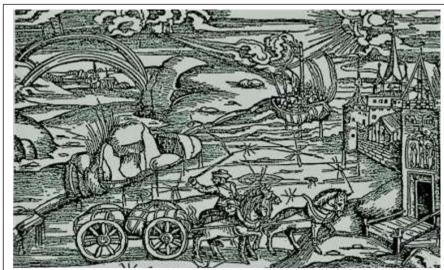
Vervoer per paard en wagen omstreeks 1520 op de Hessenweg. Gravure Vergil.