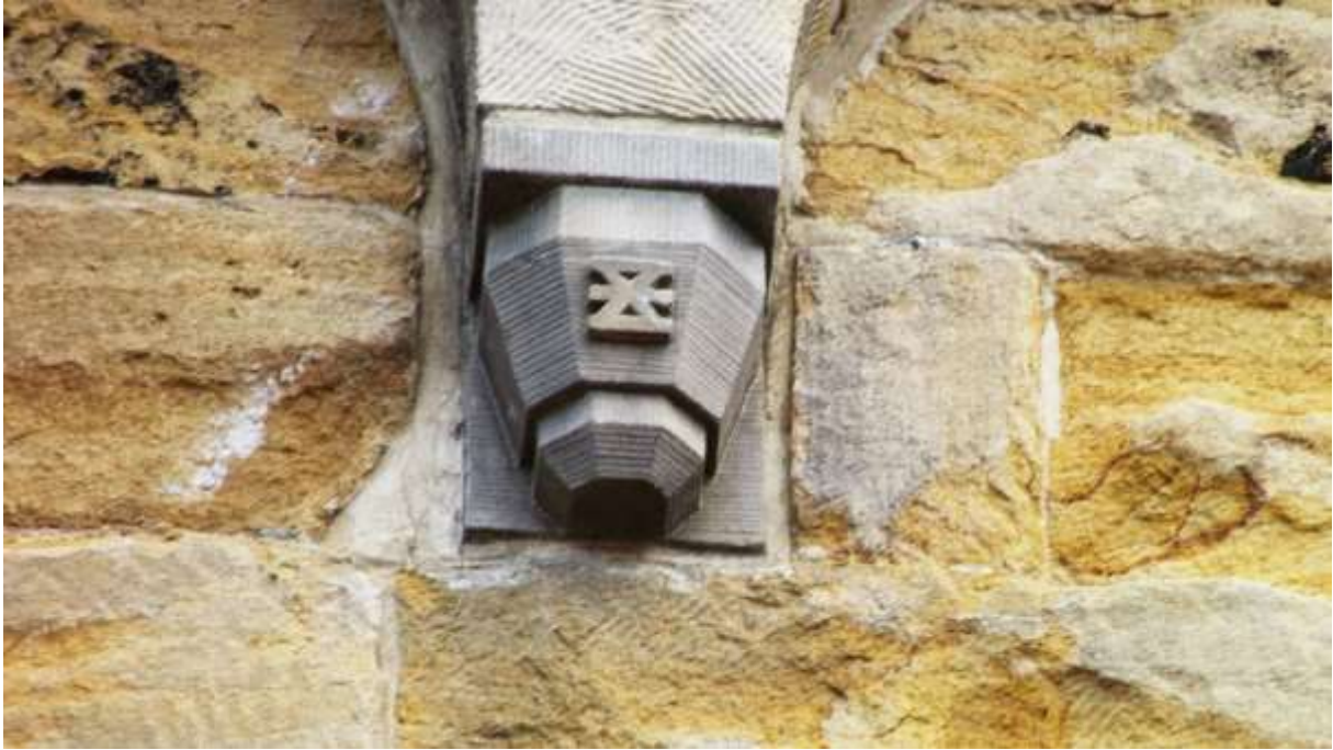
Fraaie decoraties aan de buitengevel van de kerktoren.