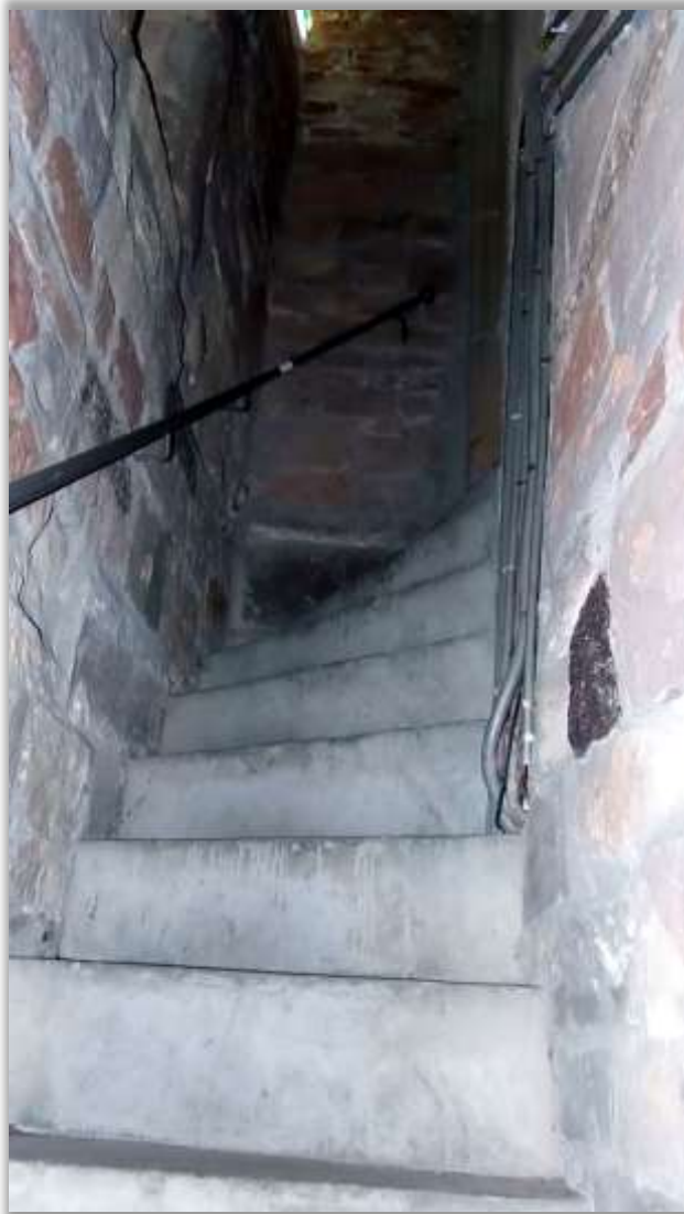
Stenen trap naar de st. Michaël kapel.

Deze weegschaal bevindt zich nog in de oudheidkamer. In 1927 en 1928 heeft er een grote restauratie plaatsgevonden van de kerk en de toren. De torenspits werd verbouwd naar het vermoedelijke model van 1840. Er komen een beiaard en nieuwe luidklokken in de toren.