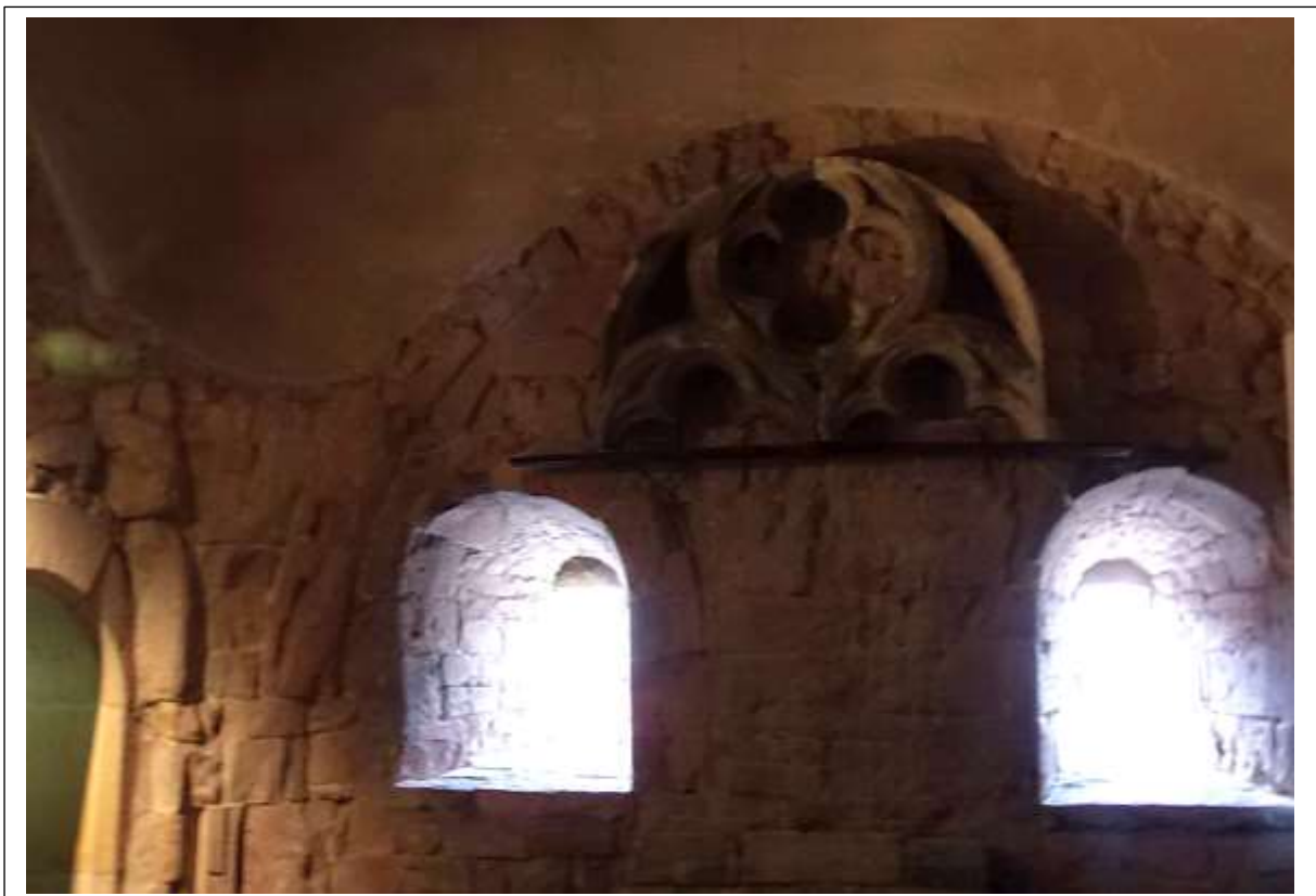
In de St. Michaël kapel bevinden zich twee vensters met uitzicht op de marktstraat. Boven de vensters zijn nog restanten te vinden van Gotische raamkozijn vermoedelijk uit de kerk na de brand van 1862.