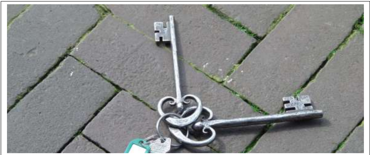
De sleutels van de kerktoeren

Nadat de kerktoeren in 1480 met één vak werd verhoogd [nog duidelijk te zien aan het kleurverschil van de bouwstenen] zijn de kerkklokken eveneens verplaatst en vanaf die tijd deden de Romaanse gebogen dubbelvensters geen dienst meer als klankgaten. Bij de herbouw van de toeren in 1862 werd het bovenste torenvak van ramen met rondbogen voorzien en gekroond door een balustrade van Bentheimer steen.