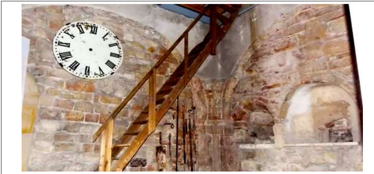
De Michaëlkapel die tevens toegang geeft tot de bovenliggende verdiepingen van de kerktoeren.