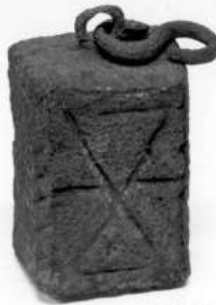
Vermoedelijk gewicht weegschaal kerktoeren

Tot grote verassing van personeel van Gemeentewerken werd er in de kerktoeren een verrassende ontdekking gedaan. Op de eerste verdieping van de toren ontdekte men in de zuid en noord muur een dichtgemetseld Bentheimer stenen poortje. Via de zuidmuur gaf dit poortje toegang tot een stenen trap die in de muur van de toren was aangebracht en afdaalde tot in de kerk aan de zuidzijde van de torenuitgang. Foto boven: vermoedelijk gewicht van de weegschaal uit de kerktoeren.