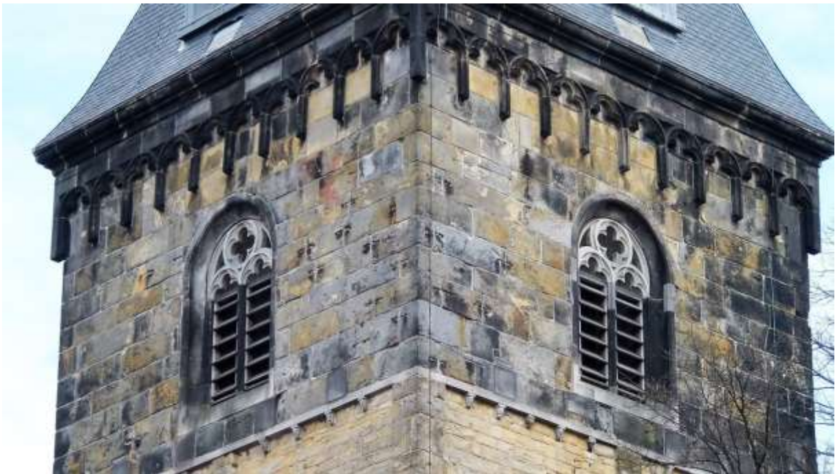
De vijfde etage van de kerktoren met de Gotische galmgaten die in 1480 is aangebracht.