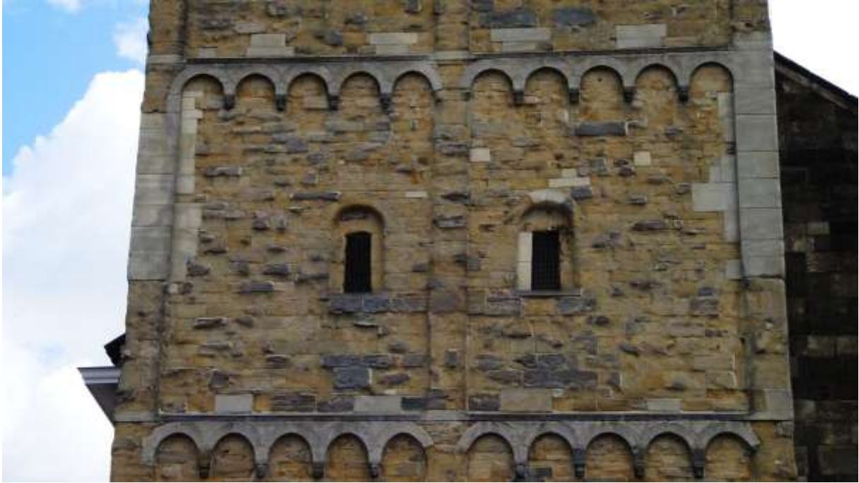
De twee "buitenramen" van de vroegere St. Michaël kapel op de eerste etage van de kerktoren.