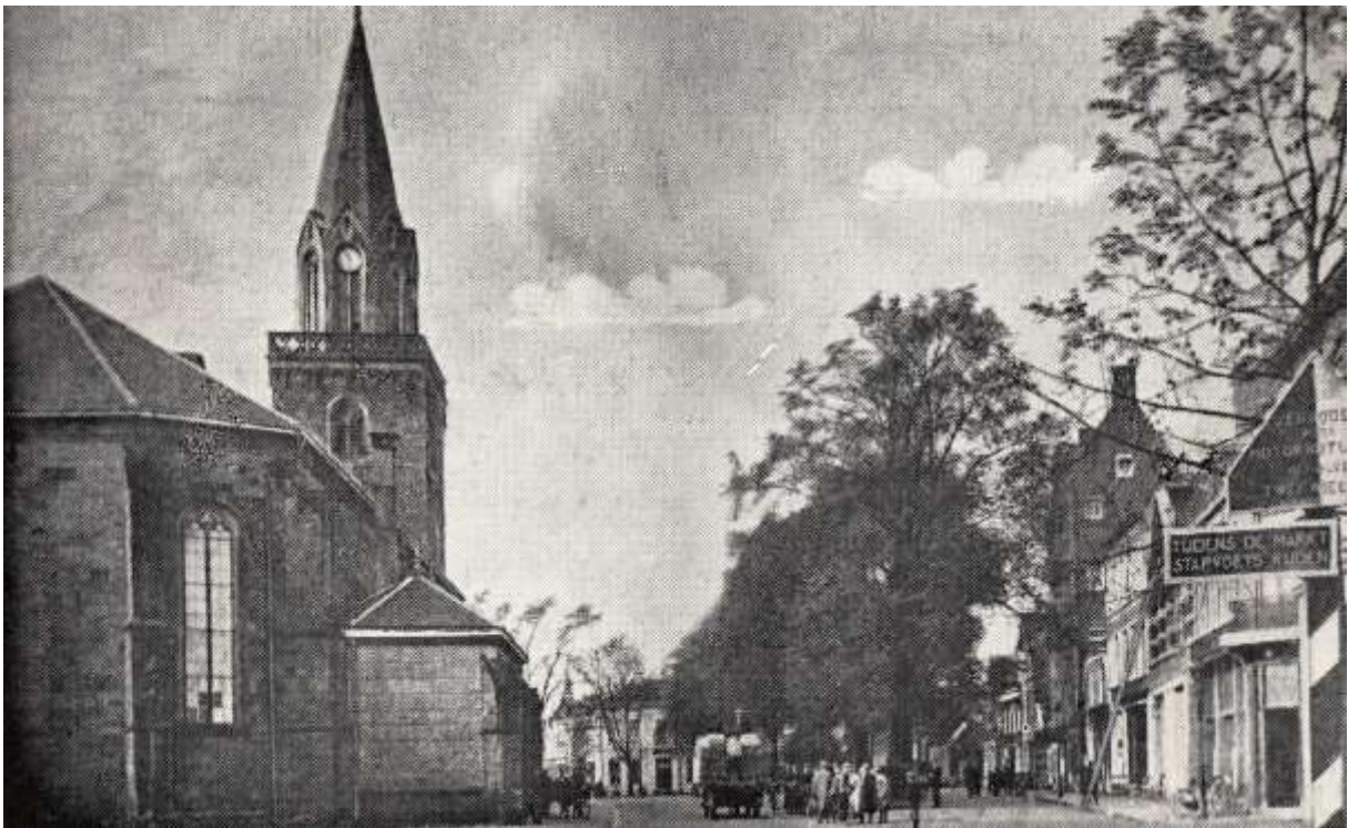
Kerktoren op de oude markt na 1862.