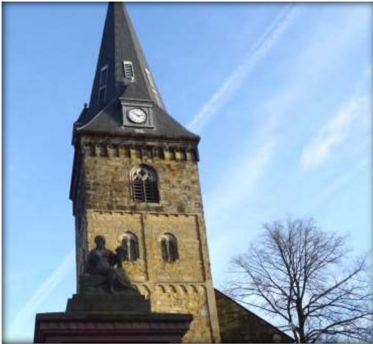
Kerktoeren op de oude markt met op de voorgrond het herdenkingsmonument van de grote brand in Enschede op 7 mei 1862.

In het bestek dat bij de wederopbouw van de toren in 1862 werd opgesteld werd de aannemer verplicht om de openingen naar de zich in de torenmuur bevindende trappen dicht te metselen.