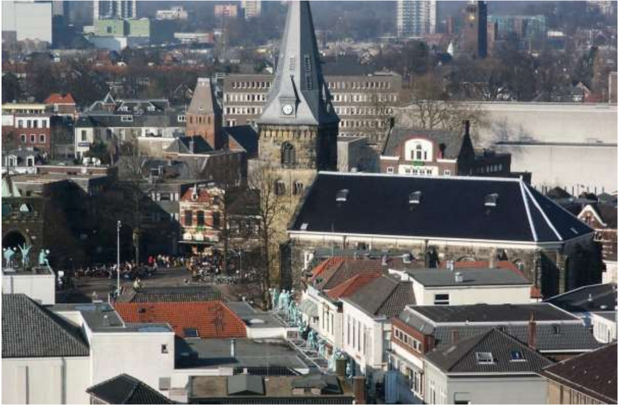
Oude markt Enschede met de Grote kerk en de kerktoren.