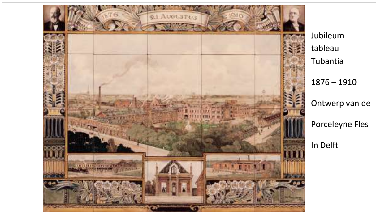
Jubileum tableau Tubantia 1876 – 1910 Ontwerp van de Porceleyne Fles In Delft