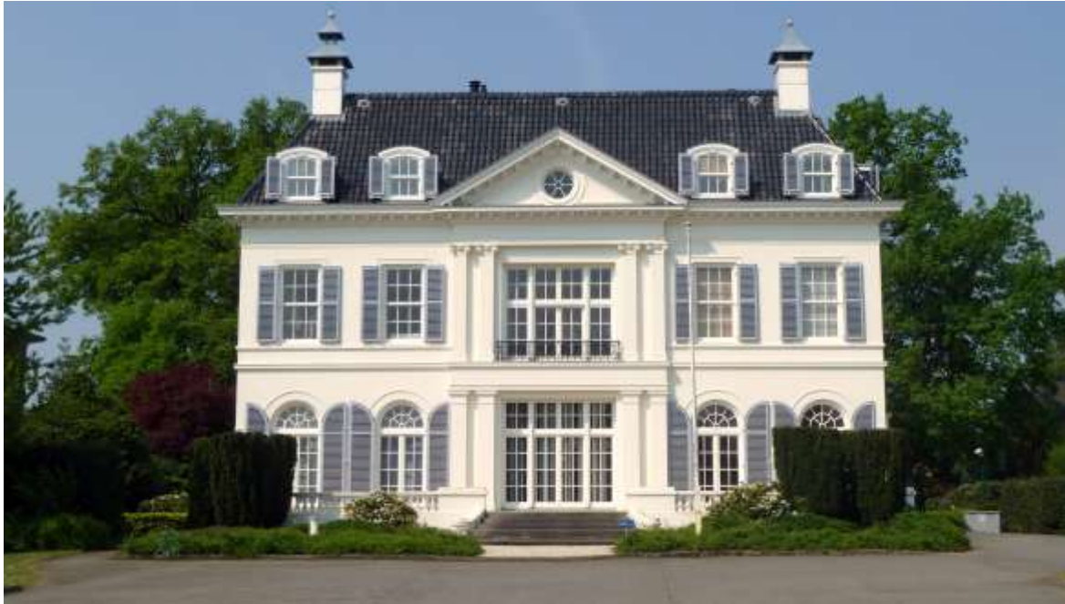
Het Witte Huis. [Rijksmonument]

De toekomst van de erfgoedzorg in Nederland staat ter discussie, de Rijksoverheid heeft behoefte aan plannen en om die te ontwikkelen is een project “Erfgoed telt” opgetuigd.