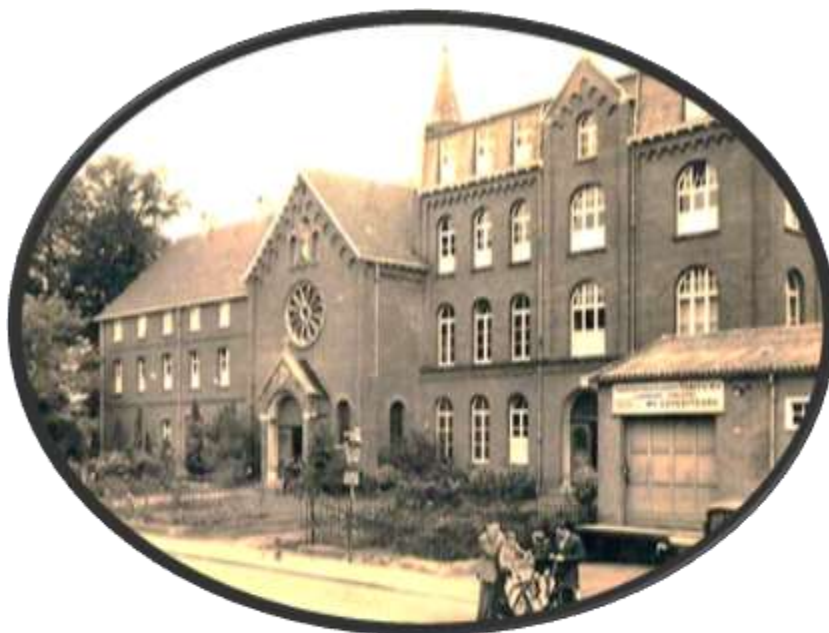
Voormalig klooster in Glanerbrug.

De discussie over dit onderwerp is nog in volle gang. Iedereen die wat kwijt wil over dit onderwerp n zich melden bij het ministerie van OCW op het email adres erfgoedtelt@ninocw.nl