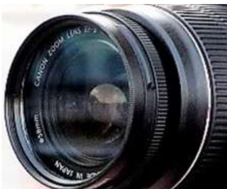
Foto materiaal is altijd welkom.

Het bestuur van de stichting cultureel erfgoed is van mening dat onze foto's in principe voor iedereen rechtevrij beschikbaar zijn wanneer hiervoor door de stichting cultureel erfgoed Enschede vooraf schriftelijk toestemming is verleend en uitsluitend bestemd zijn voor niet commerciële doeleinden. Het bestuur wil hiermee bereiken dat een zo groot mogelijk doelgroep van non profit organisaties en particulieren gebruik kunnen maken van dit fotografisch materiaal. Hebt u twijfel over de herkomst van een foto neem dan contact op met de redactie van de nieuwsbrief. info@cultureelerfgoedenschede.nl