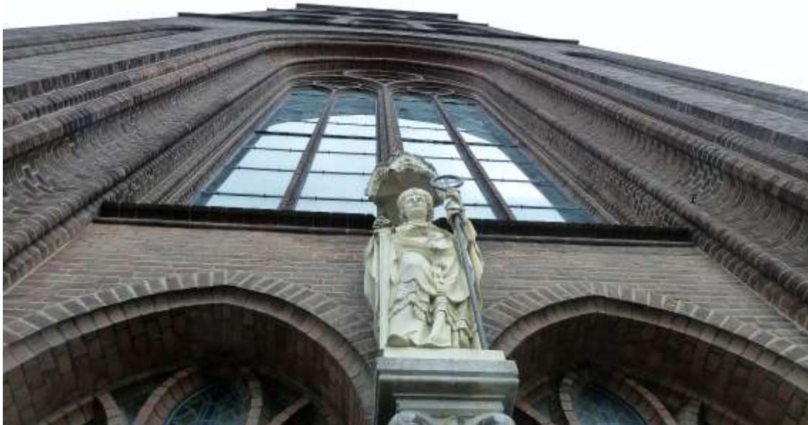
St. Lambertus basiliek in Hengelo.