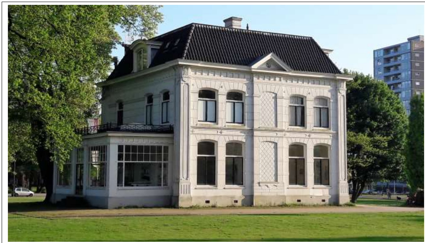
Villa Blijdenstein in park Blijdenstein foto boven 2017 foto onder 1960. Let op de verschillen