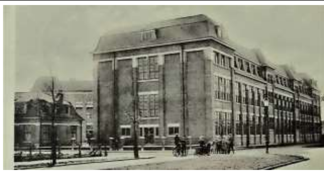
Let eens op de fraai gebogen kolommen op de derde etage van de toenmalige Ambacht School die al sinds 1950 al zijn verdwenen.

Er zijn veel buitenramen toegevoegd maar ook de hoogte van verschillende ramen in de buitengevel zijn vergroot. Het ligt tevens in de bedoeling om de bijpassende conciërgé woningen met de nog originele dak structuur uit 1922 [zie onderstaande foto] aan de naastgelegen Boddenkampstraat te slopen.