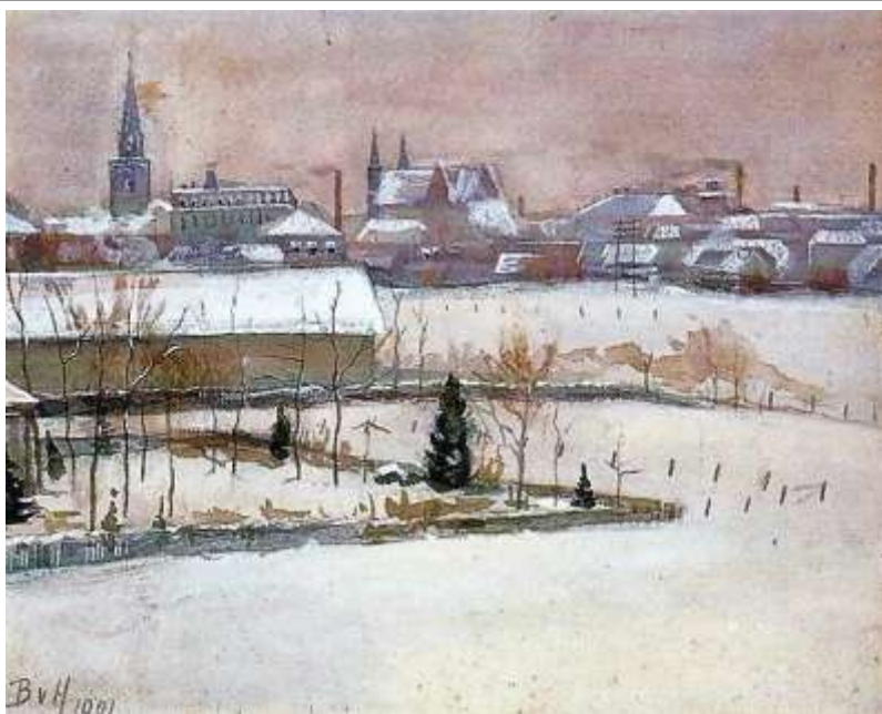
Gezicht op Enschede

Het bijgaand schilderij is een gezicht op het centrum van Enschede vanuit noord westelijke richting. Duidelijk zichtbaar is de st. Josef kerk en de twee torens van de R.K. Kerk op de oude markt. Het schilderij toont de situatie van Enschede omstreeks 1900.