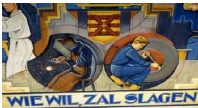
Muurschildering in het trappenhuis van de voormalige Ambachtschool aan de Boddenkampsingel.

Auteur: Bert Haer Monumentenloket gemeente Enschede. 29 mei 2017.