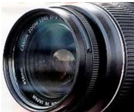
Foto materiaal is altijd welkom.

Het bestuur van de stichting cultureel erfgoed is van mening dat onze foto's in principe voor iedereen rechtenvrij beschikbaar zijn wanneer hiervoor door de stichting cultureel erfgoed Enschede vooraf schriftelijk toestemming is verleend en uitsluitend bestemd zijn voor niet commerciële doeleinden. Het bestuur wil hiermee bereiken dat een zo groot mogelijk doelgroep van non profit organisaties en particulieren gebruik kunnen maken van dit fotografisch materiaal. Hebt u twijfel over de herkomst van een foto neem dan contact op met de redactie van de nieuwsbrief. info@cultureelerfgoedenschede.nl