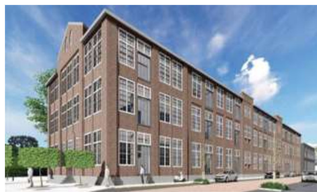
De Art Impression van de voormalige Ambachtsschool die de vorm en uitstraling heeft gekregen van een modern appartementencomplex. Renpart de nieuwe eigenaar ontwikkeld hier 90 huurappartementen.

Gelukkig zou je kunnen zeggen dat de voormalige Ambachtschool destijds de monumentstatus heeft gekregen en niet ten prooi is gevallen aan de slopershamer. Toch moeten we constateren dat het monumentale verval van de voormalige Ambachtschool al sinds 1950 is ingezet en nu wederom architectonisch gaat inleveren.