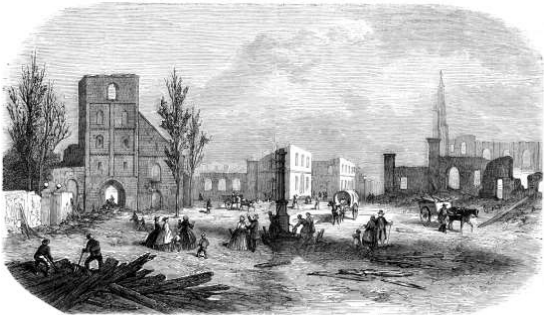
De situatie op de oude markt na de verwoestende brand op 7 mei 1862.

In de laatste twee eeuwen is Enschede getroffen door verschillende rampzalige gebeurtenissen onder andere de stadsbrand op 7 mei 1862 en de vuurwerkramp op 13 mei 2000. Bij de vuurwerkramp waren 23 dodelijke slachtoffers te betreuren en bij de stadsbrand in 1862 vielen er twee doden. Enschede herdenkt jaarlijks de vuurwerkramp maar de laatste herdenking van de stadsbrand vond plaats bij de 150 jarige herdenking van de brand in 2012.