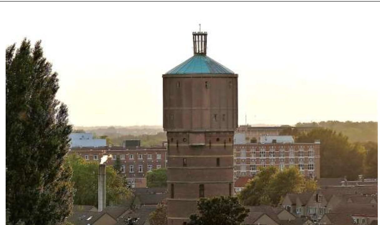
Watertoren Hoog en Droog.