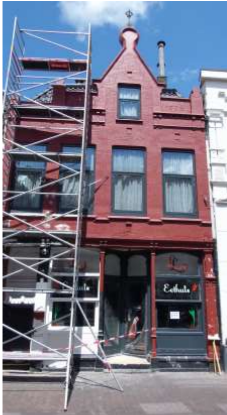
Er was wel degelijk sprake van achterstallig onderhoud.[zie foto onder]

Is de rode verfbeurt wederom te herstellen? Jazeker, desgevraagd hebben wij hierover een positief advies ontvangen van een gerenommeerd onafhankelijk verfadvisiebureau. En ook dat zal veel Enschedeërs weer geruststellen maar of de eigenaar van het pand daar ook zo overdenkt valt nog te betwijfelen.