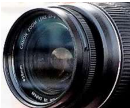
Foto materiaal is altijd welkom.

Het bestuur van de stichting cultureel erfgoed is van mening dat onze foto's in principe voor iedereen rechtenvrij beschikbaar zijn wanneer hiervoor door de stichting cultureel erfgoed Enschede vooraf schriftelijk toestemming is verleend en uitsluitend bestemd zijn voor niet commerciële doeleinden. Het bestuur wil hiermee bereiken dat een zo groot mogelijk doelgroep van non profit organisaties en particulieren gebruik kunnen maken van dit fotografisch materiaal. Hebt u twijfel over de herkomst van een foto neem dan contact op met de redactie van de nieuwsbrief. info@cultureelerfgoedenschede.nl