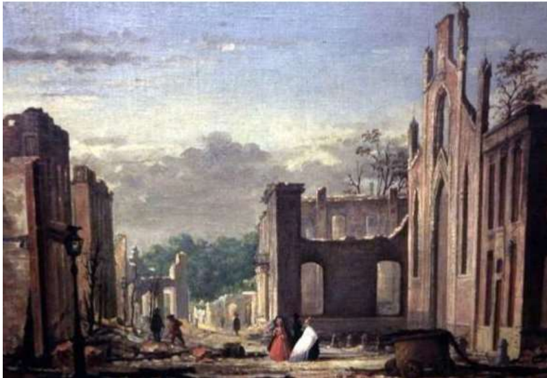
Schilderij van H. Valkenburg 1862.

Het schilderij toont het gezicht vanaf de oude markt richting Langestraat.