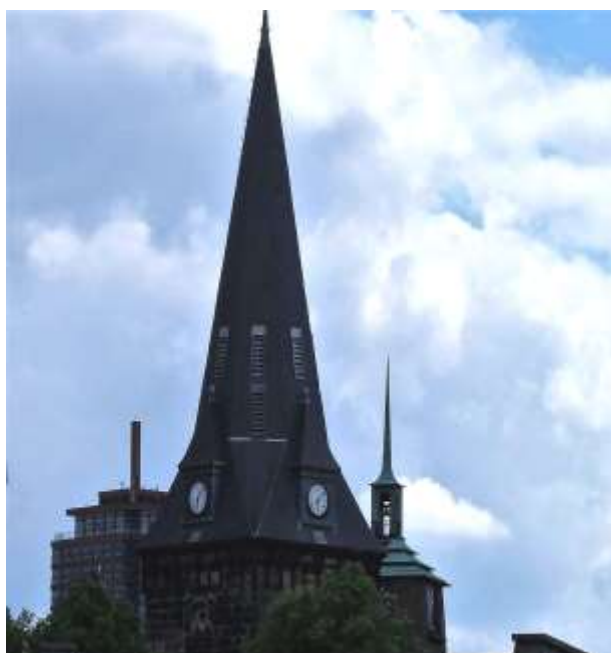
Drie Enschedese beeldbepalende torens in één fotografisch beeld gevangen.